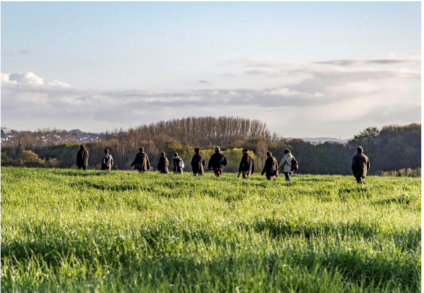
Winterse Woestijnwandeling

Overigens hebben wij de voorbije maanden van verschillende mensen prachtige zaken mogen ontvangen. Al die uitzonderlijke zaken kun je komen bekijken en bestuderen, de eerste zaterdag van de maand (Erfgoedkelder, GC Het Koetshuis Strijtem, 9 tot 12 uur)