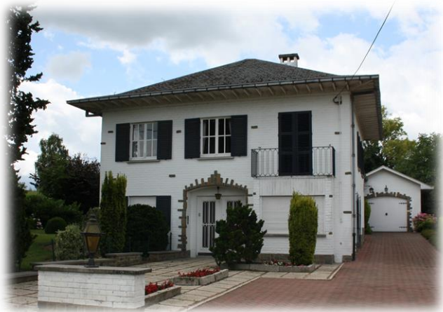
Het notarishuis aan de Lombeekstraat